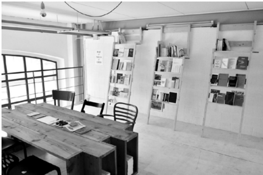
Foto della Cantieroteca, ospitata dall'associazione Careof presso La Fabbrica del Vapore in via Procaccini 4, Milano